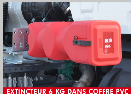
EXTINCTEUR 6 KG DANS COFFRE PVC