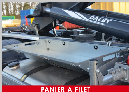
PANIER À FILET